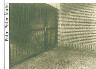
Önskar vi en utveckling mot mer "säkerhet" eller finns det andra sätt att skapa ökad trygghet?