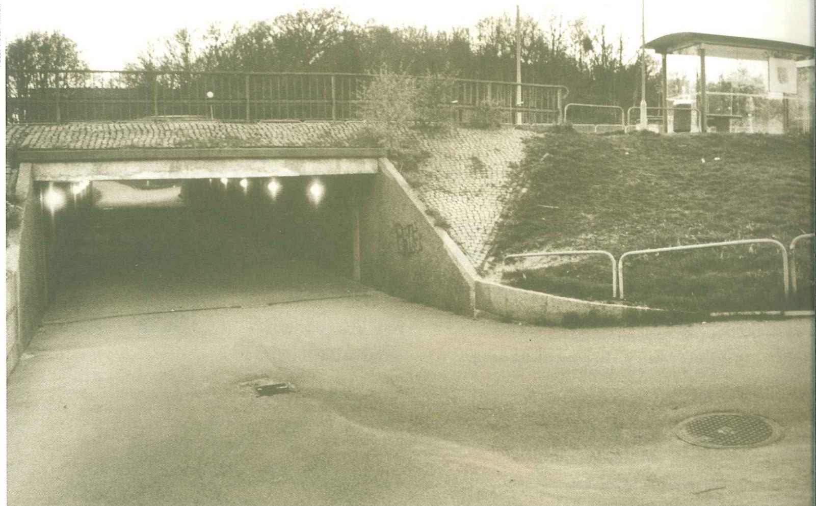
Gångtunneln kan stå som symbol för konflikten mellan "trygg" och "säker" stadsmiljö. Ska vi bygga bort risker i samhället med hjälp av tunnlar, galler och grindar eller skapar det nya risker av annat slag som ökar människors känsla av otrygghet?